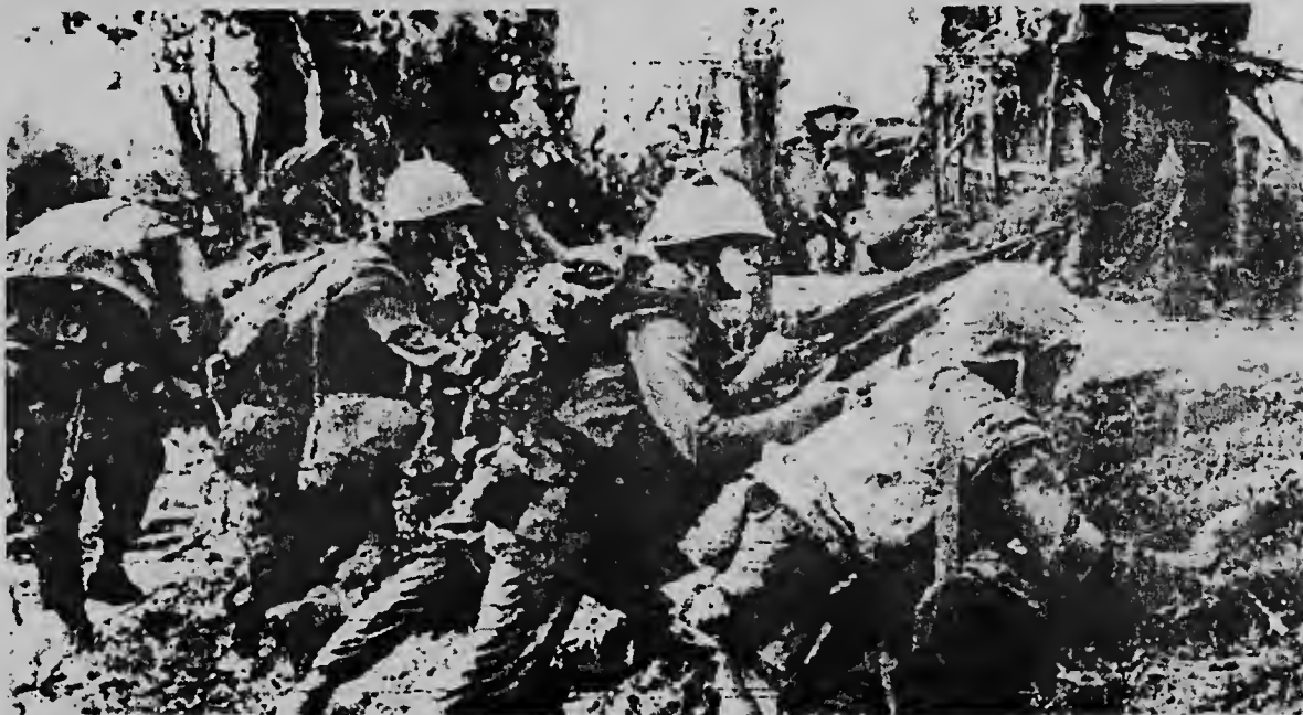
Infantenan di marina norteamericano ta basha unu tras di otro den e region banda di Duc Pho pa apoya trupanen Coreano cu a cai den un trampa di dos batallón di trupanen comunista.

"Clave di e cuestion na Vietnam no ta si Merca bombardea Norte of laga, sino qu e tropa agresivo mericano mester worde retira for di Vietnam pa caba cu e agresion norteamericano pa asina permiti pueblo Vietnemes regla nan propio problema".